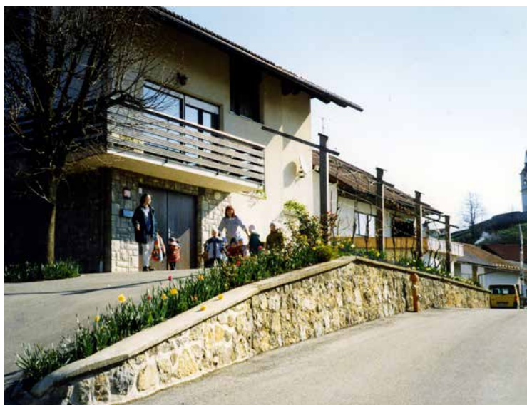
Družinsko varstvo Brulec je prostor za naše najmlajše vrtičkarje nudilo kar 25 let.