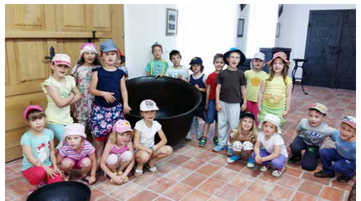
Metulji na obisku Železolivarskega muzeja na Dvoru, september 2014.