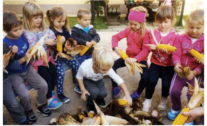
Ličkanje koruze pri Kelšinovih, jesen 2016.

Otroci so zelo veseli in ponosni, če pridejo njihovi starši ali stari starši v skupino – samo na obisk ali druženje, še posebej, kadar nekaj predstavijo ali naredijo. Otroci so bolj pozorni in je zanje