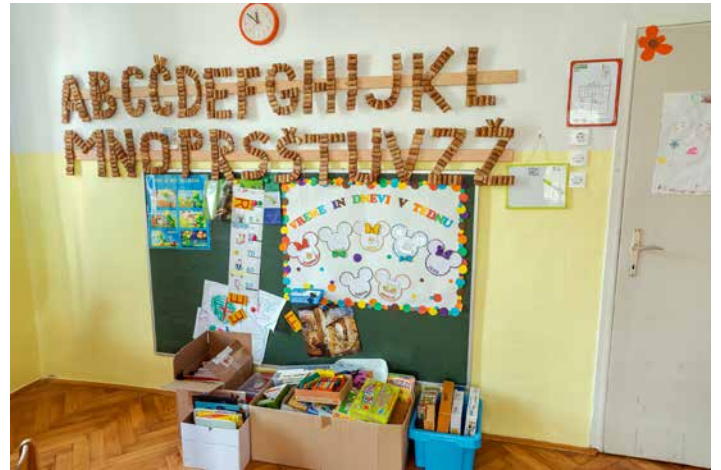
Igralnica Miškolinov v pripravi na selitev v dvorano prizidka telovadnice.