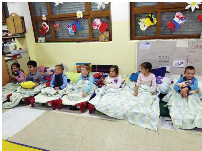
Ribice so pripravljene na počitek po vznemirljivem dogajanju v noči v vrtcu, maj 2019.