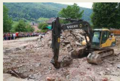
Starega so že porušili.