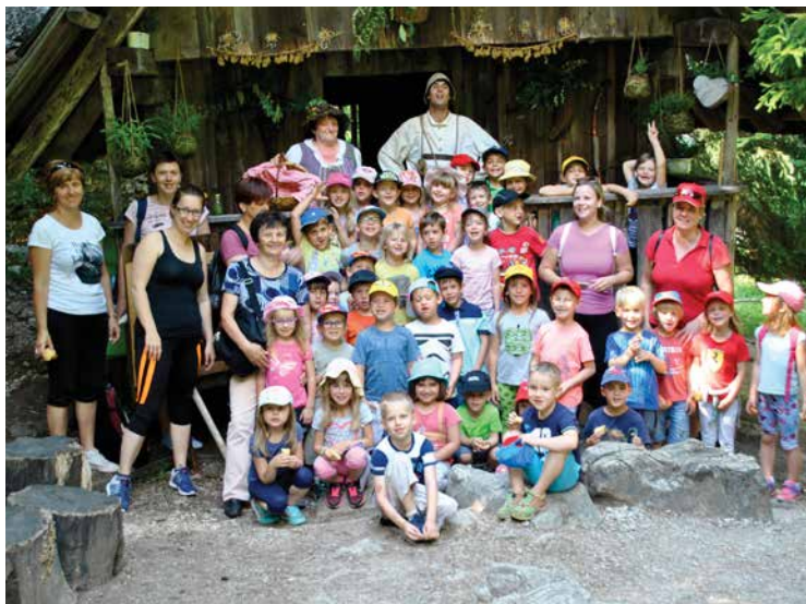
Miškolini in Ribice na obisku pri Kekcu in Pehti – zaključni izlet v Kekčevo deželo, maj 2017.

Leto 2016/17 : Ponovno se je pojavila potreba, da šolsko leto začnemo z dvanajstimi oddelki, v katere je bilo do zaposlitve prostih mest vključenih 199 varovancev. Na čakalnem seznamu za vključitev med letom je ostalo nekaj otrok, ki jim nismo uspeli zagotoviti sprejema v vrtec. V sodelovanju s šolo smo organizirali 4. dobrodelni koncert. Podružnična šola Dvor in z njo enota vrtca na Dvoru je obeležila deseto obletnico izgradnje nove šole. Za otroke najstarejših oddelkov smo prvič organizirali zaključni izlet v Kekčevo deželo. Posodobitev knjižnega gradiva za potrebe projekta CICI bralček je bila realizirana z izkupičkom božične tržnice delavk vrtca. Na Dvoru je bilo urejeno igrišče za vrtcem – postavljena je bila ograja in novo kombinirano igralo za najmlajše otroke, ki je bilo delno financirano z izkupičkom gledališke predstave delavk enote Dvor. V enoti na Jurčičevi je v kuhinji zaradi počene talne cevi prišlo do iztekanja vode, zaradi česar je bila potrebna dolgotrajna sanacija parketa v igralnici Muckov. Ponovno je bil saniran parket v igralnici Miškolinov v stari šoli.