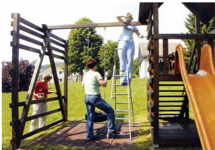
Delavke vrtca pri barvanju igral na Jurčičevi, maj 2011.

Leto 2006/07 : Najpomembnejši dogodek v tem šolskem letu je bila selitev vrtca v lepe, svetle prostore novozgrajene Podružnične šole Dvor s tremi vrtčevskimi igralnicami. V pritličju je tudi kuhinja, ki je postala centralna kuhinja za potrebe obeh vrtcev, v Žužemberku in na Dvoru. Spomladi 2007 so bile pri vrtcu na Jurčičevi s pomočjo otrok, delavk, staršev in starih staršev na igrišču zasajene ciprese.