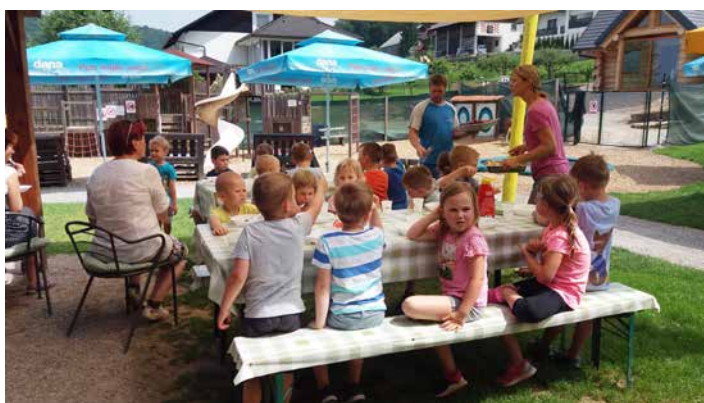
Zaslužena malica za Miškoline po ogledu živali in vznemirljivi igri na igralih, Ranč Aladin, junij 2019.

Otroci naših najstarejših skupin se na zaključni izlet običajno odpeljejo v Kranjsko Goro na srečanje z junaki Vandotovih zgodb o Kekcu, ki domujejo v Kekčevi deželi.