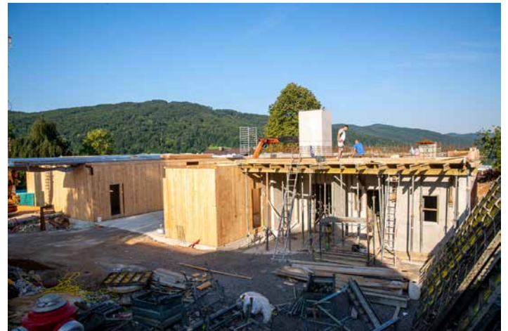
10. 7. 2018 Priprave na gradnjo zgornje etaže stavbe.