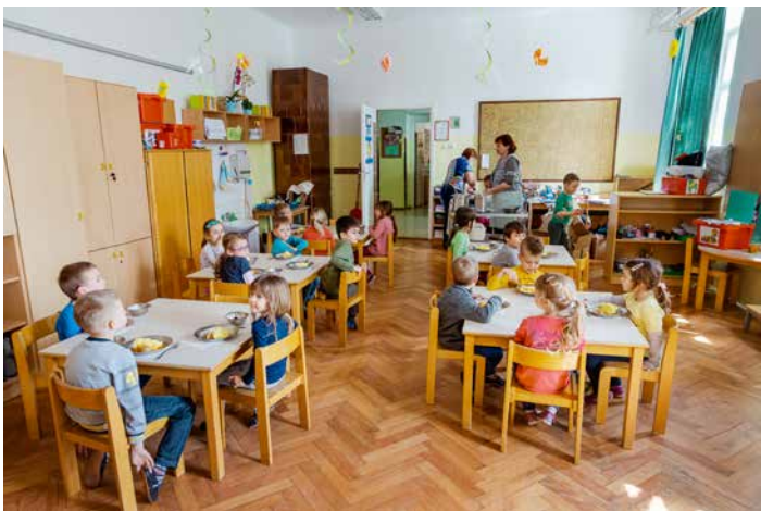
Ribice čakajo, da jim dežurni zaželi dober tek.