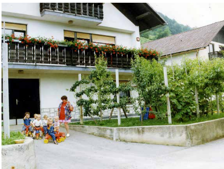
Igra na prostem v Družinskem varstvu Gliha na Dvoru.

Leto 1989 : V delovni organizaciji Iskra so uvedli evropski delovni čas, posledično se je delovni čas vrtca podaljšal za eno uro.