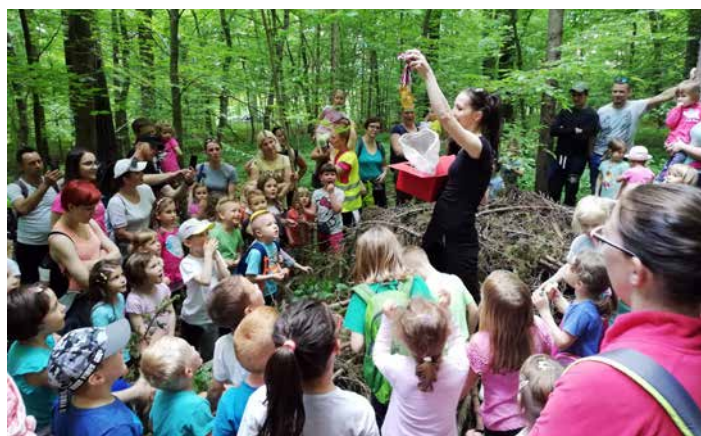
Zaključek gibalnih uric - lov na skriti zaklad, maj 2019.

Bilo je veslo, zabavno, plesno-telovadno obarvano. Hvala otrokom in staršem, ker se trudite, da so naša druženja na gibalnih uricah vedno dobro obiskana ter z veseljem premagujete izzive. Pa še pozdrav: "HIP, HIP, HURA!"