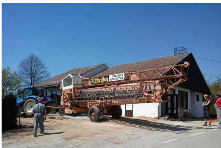
19. 4. 2018 Izvajalec gradbenih del GPI Tehnika je pripeljal dvigalo za pomoč pri rušenju.