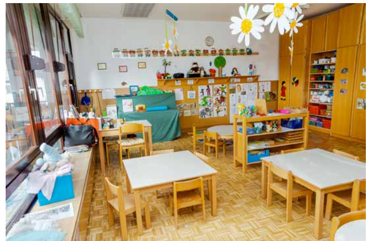
Igralnica Zajčkov, ki pa so medtem veselo skakljali na igrišču.