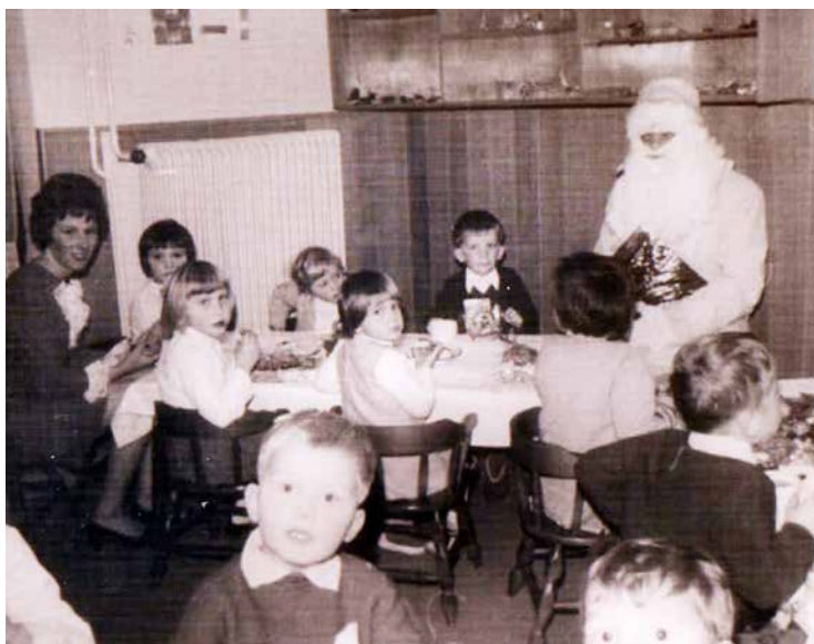
Prvo vrtčevsko praznovanje novega leta v bloku, december 1970.