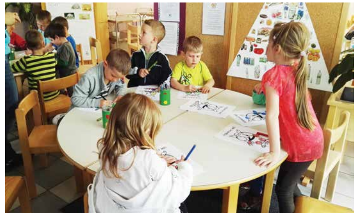
Projekt Pasavček, ki s sloganom Red je vedno pas pripet spodbuja otroke in starše k dosledni uporabi otroških sedežev in varnostnih pasov.

Otroci oddelkov od 4 do 6 let sodelujejo v projektu Pasavček, s čimer preko različnih dejavnosti in ob vključevanju staršev in policista spodbujamo dosledno in pravilno uporabo otroških varnostnih sedežev in pripetosti otrok med vožnjo. Slogan je Red je vedno pas pripet! Otroci z žigom Pasavčka, maskoto projekta, sami spremljajo pripetost in uporabo ustreznih varovalnih sedežev.