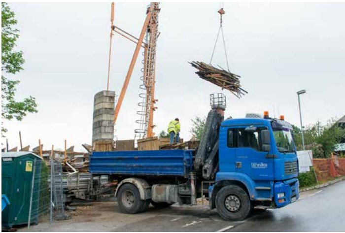
4. 5. 2018 Odvoz velikih količin gradbenega materiala.