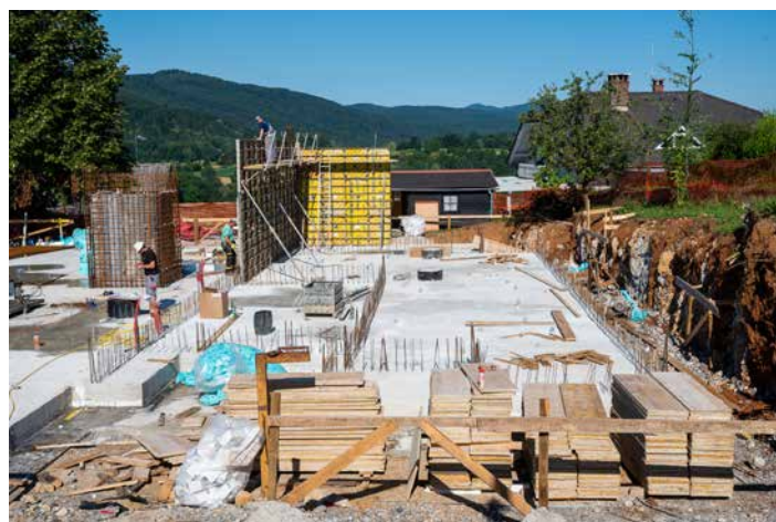
19. 6. 2018 Začetek postavljanja konstrukcije.