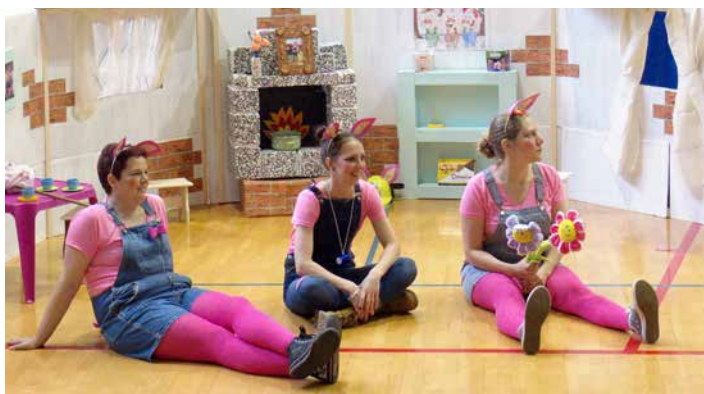
Trije prašički v varnem zavetju zidane hišice, april 2018.