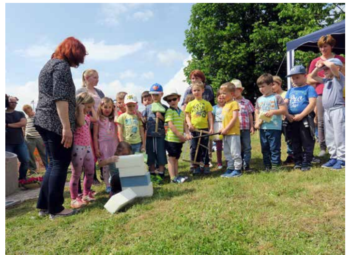
Ribice so se predstavile s točko Pri nas pa vrtec zidamo.