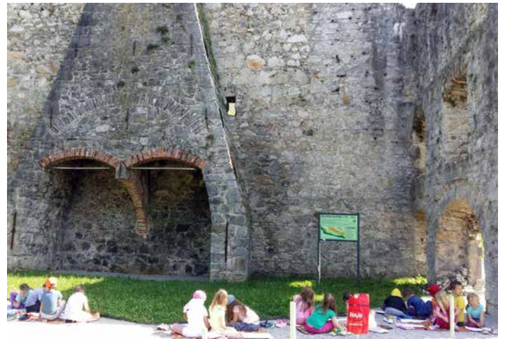
Likovno ustvarjanje otrok pred ostanki plavža na Dvoru, maj 2015.