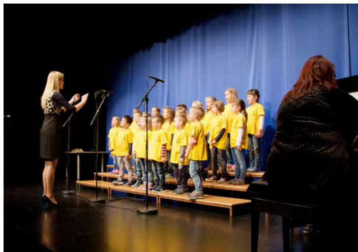
Cici zborček oddelka Ribice na reviji Gugajo se pesmice, maj 2019.

Zaključujem z mislijo: »LEPA PESEM SRCE RAZVEDRI IN PREŽENE VSE SKRBI.«