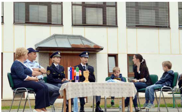
Zaključek gibalnih uric na prireditvi Šport in špas z gostom Jurijem Tepešem, maj 2016.