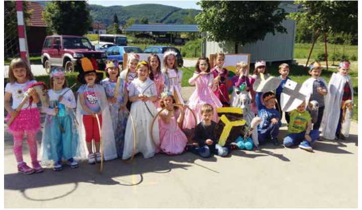
V okviru tematskega sklopa Grajski teden je v oddelku Metulji lepo zaživela igra vlog, maj 2016.