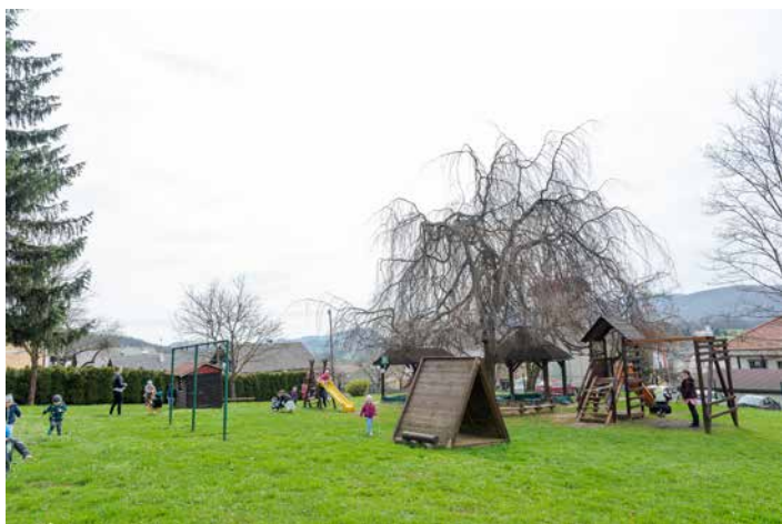
Igrišče z obilo naravne sence in lesenimi igrali je omogočalo varno in sproščeno bivanje na prostem.