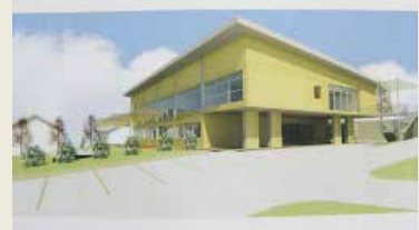
Energetsko varčen vrtec bo imel devet oddelkov in bo zgrajen v dveh nadstropjih.