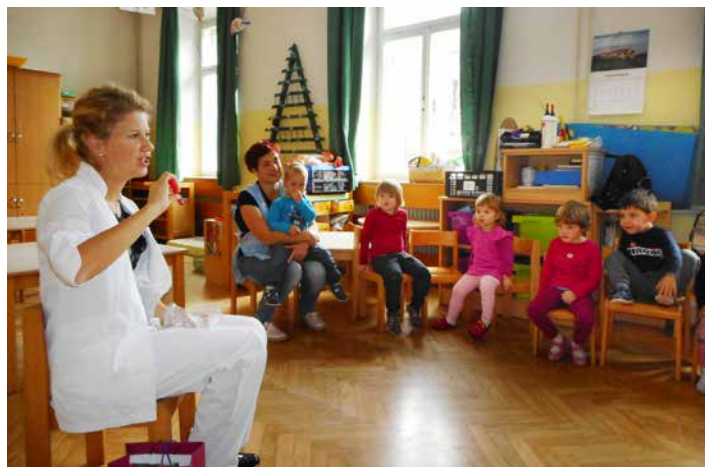
Zobozdravnica Polonca Župevec - Klarina mamica v oddelku Mravljice, november 2018.

Tudi ekologija nam ni tuja. V prav vseh skupinah načrtujemo dejavnosti s tega področja, seveda starosti primerno. Otroke navajamo na skrbno ravnanje z vodo, električno energijo, papirjem in na ločevanje odpadkov.