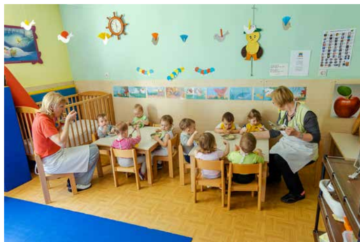
Družinsko varstvo Brulec – Polškova igralnica.