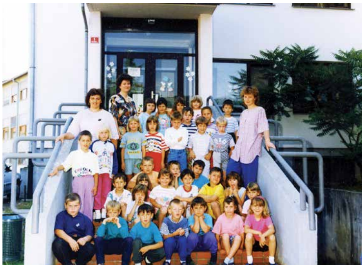
Oddelek priprave na šolo v prenovljenih prostorih stare šole, september 1995.