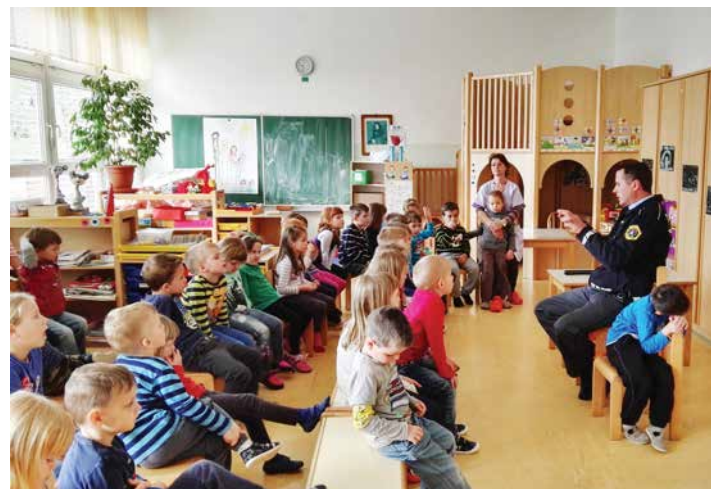
Obisk očka policista v skupini Metulji, april 2017.