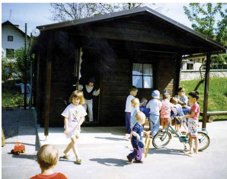
Igra pred Grahkovo hiško, poletje 1997.