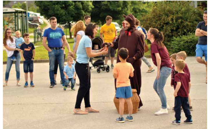
Medo je za vsako skupino prinesel darilo – kozarec medu, junij 2019.

Letos so se Pikine igrarije preimenovali. Postali smo Vrtec Sonček, enota Medo. Nekdo je otrokom po vrtcu že pustil sledi. Le kdo? Tako je bil letošnji zaključek namenjen temu, da smo skupaj z otroki odkrivali, kdo je ta skrivni obiskovalec vrtca.