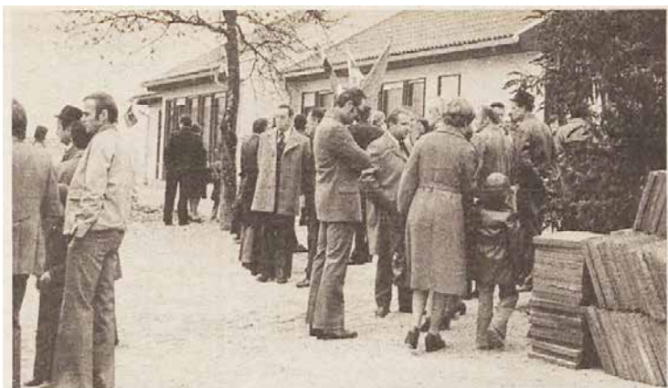
V PONOS ŽUŽEMBERKA – Na fotografiji je videti slavnostno razpoloženje, kakršno je vladalo 7. novembra v Žužemberku ob otvoritvi novega vrtca za 60 predšolskih otrok.