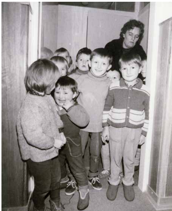
Začetki organiziranega otroškega varstva v Suhi krajini v prostorih nekdanje Krajevne skupnosti.

Leto 1975 : Ukinjen je bil popoldanski oddelek. Število otrok se je zmanjšalo na 40. Za šoloobvezne otroke se je v popoldanskem času izvajal program Mala šola.