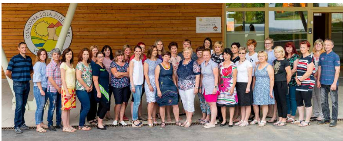
Skupinska fotografija vseh zaposlenih v Vrtcu Sonček, junij 2019.

K nemotenemu delovanju vrtca Sonček v okviru svoje redne zaposlitve v OŠ Žužemberk prispeva in je prispevalo tudi strokovno in tehnično-administrativno osebje šole, za kar se jim najlepše zahvaljujemo.