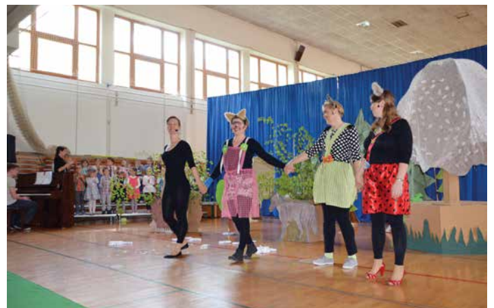
Srečen konec za Tri muce in navdušena publika, april 2016.