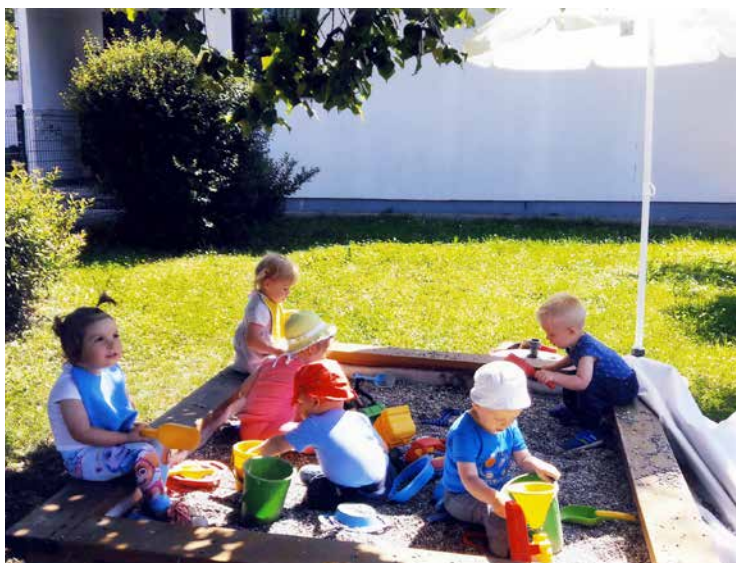
Medvedki pri igri v novem peskovniku, poletje 2014.