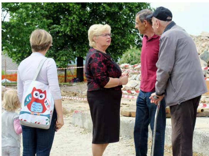
Na slovesnosti so se nam pridružili tudi sosedge starega (in novega) vrtca.