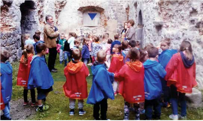
Miškolini na vodenem ogledu gradu v Žužemberku, maj 2018.