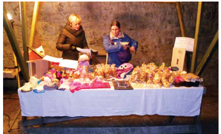
Priprave na dobrodelno tržnico vrtca, december 2015. Izkupiček je vedno namenjen nakupu didaktičnih sredstev in pripomočkov za obogatitev dela v vrtcu.

V času veselega decembra se nam starši in otroci pridružijo na čarobnem pohodu z lučkami . Lučke v rokah otrok in staršev simbolično predstavljajo toplino in upanje, ki ju nosimo po kraju do vrtca oziroma gradu v Žužemberku, kjer nas čaka dišeč predpraznični čaj ter slastno pecivo, ki ga spečejo mamice ali babice. Pohod z lučkami zaključimo z nastopom cici zborčka in predstavo delavk ali otrok dramskega krožka OŠ Žužemberk ter božično tržnico, kjer prodajamo voščilnice in raznolike izdelke strokovnih delavk vrtca, ki so lahko lepa praznična darila.