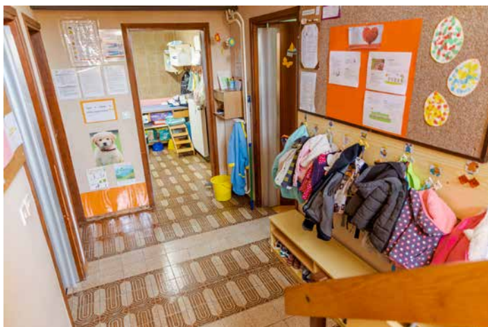
Garderoba v Družinskem varstvu Brulec.