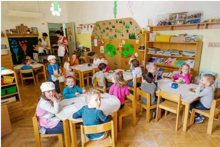
Mravljice pri slastnem kosilu.