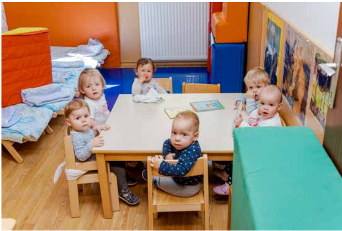
V Družinskem varstvu Brulec je od leta 2012 domoval tudi polovični oddelek Medvedki.