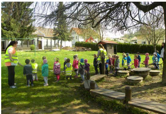
Zadnji dnevi našega starega vrtca – obisk bivših stanovalcev na starem igrišču, april 2018.