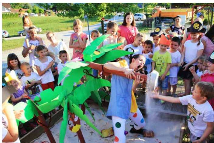
Pika je tako močna, da lahko izpuli celo palmo ... in pod njo odkrije zaklad, junij 2018.

Lansko leto so otroci skupaj s Piko in klovnom Božom v deželi Čira-čara, izvajali razne gibalne izzive in akrobacije, kot je hoja po vrvi, skozi pajkovo mrežo, po čutni poti itn. Na koncu so si ogledali spektakularno hula hop akrobacijo, ki sta jo izvedli pravi artistki s hula hop obroči.