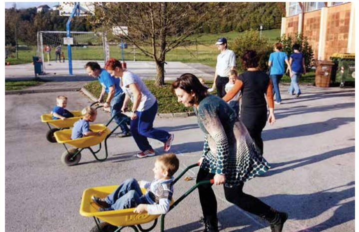
Kostanjev piknik z igrami brez meja v enoti Dvor, oktober 2014.

V času veselega decembra se nam starši in otroci pridružijo na čarobnem pohodu z lučkami . Lučke v rokah otrok in staršev simbolično predstavljajo toplino in upanje, ki ju nosimo po kraju do vrtca oziroma gradu v Žužemberku, kjer nas čaka dišeč predpraznični čaj ter slastno pecivo, ki ga spečejo mamice ali babice. Pohod z lučkami zaključimo z nastopom cici zborčka in predstavo delavk ali otrok dramskega krožka OŠ Žužemberk ter božično tržnico, kjer prodajamo voščilnice in raznolike izdelke strokovnih delavk vrtca, ki so lahko lepa praznična darila.