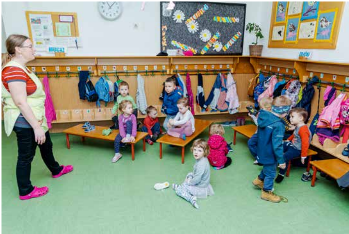
Zajčki pri odhodu na igrišče.