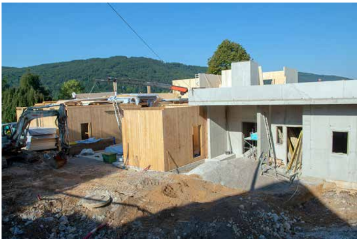
19. 7. 2018 Postavljanje sten v zgornji etaži.