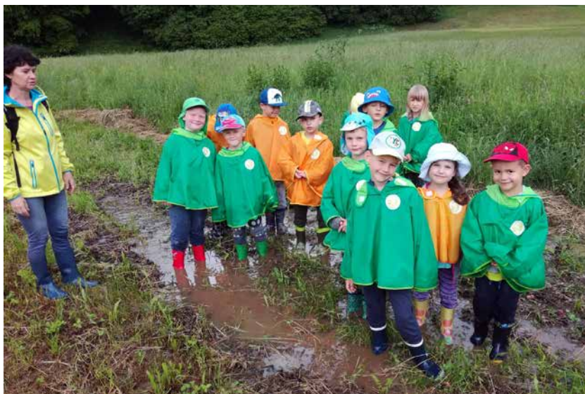
Dež nas ni oviral, da se ne bi odpravili raziskovat narave; letovanje v CŠOD Čebelica, maj 2019.

Kljub temu da se letovanja otroci veselijo in uživajo ob druženju z vrstniki, se občasno pojavijo tudi stiske, tako da smo jim na voljo za tolažbo, saj smo v vlogi nadomestnih staršev. Vzgojiteljice in pomočnice vzgojiteljic ponoči bdimo nad vsakim stokom, škripanjem postelje, klicanjem, smrkanjem. Seveda se je včasih treba tudi h kašnemu otroku uleči in mu pomagati, da se za-