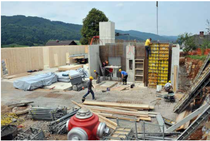
30. 6. 2019 Spodnja etaža dobiva svojo podobo - zidani del za kuhinjo in servisne prostore ter lesen montažni del za igralnice.