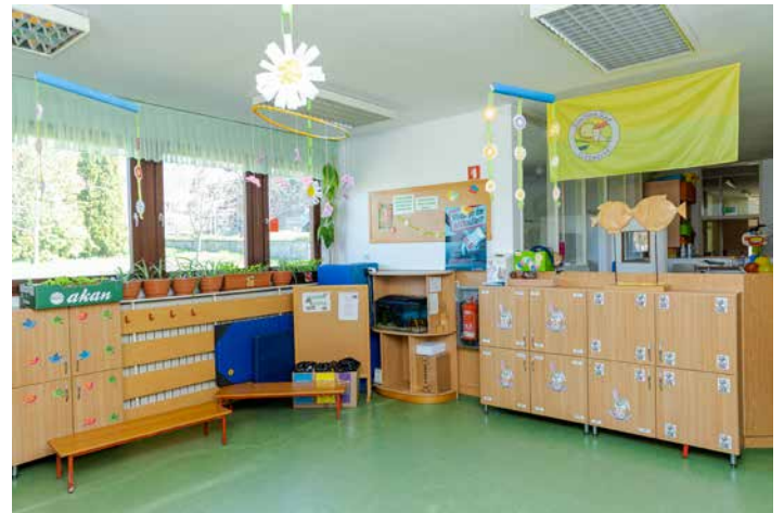
Garderoba v starem vrtcu - majhna, a vedno prijetno urejena.