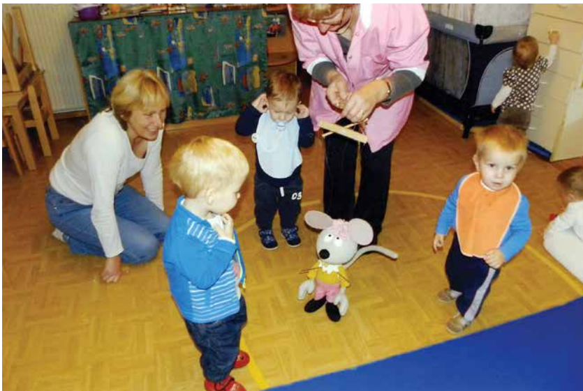
Sapramiška – glasnica projekta Botrstvo na obisku pri najmlajših v VVD Brulec, november 2013.

biti vseeno, v kakšne osebnosti se bodo ob naših spodbudah razvili.