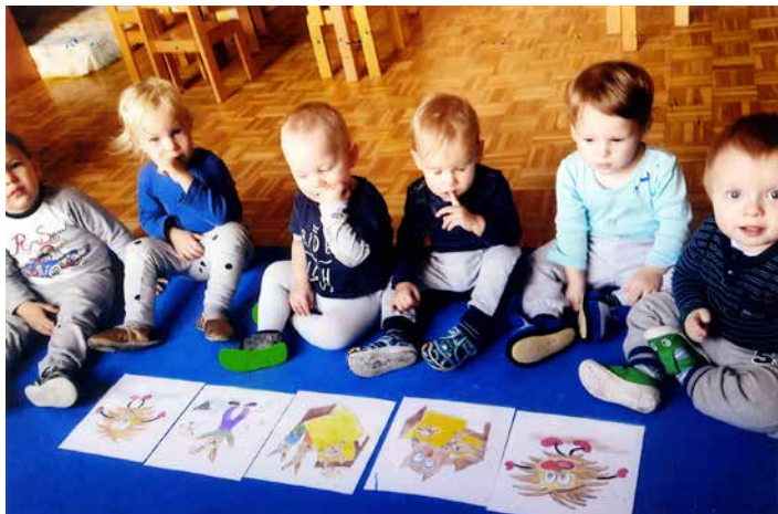
Tudi naši najmlajši varovanci se preko zgodb seznanjajo s pomembnimi temami, kot je zdravje. Ptičke je zgodbica o Škratku Prehladku zelo pritegnila, november 2017.

jeseni začnemo s temo Moje zdravo telo, ki se nadaljuje s tradicionalnim slovenskim zajtrkom in medenim tednom. V tem času imajo starejši otroci običajno plavalni tečaj, kjer si pridobijo večšine plavanja in prilagajanja na vodo. Za to usposobljene vzgojiteljice in vaditelji plavanja otrokom pomagajo, da premagajo strah pred vodo, ali izpopolnijo že usvojene večšine plavanja.