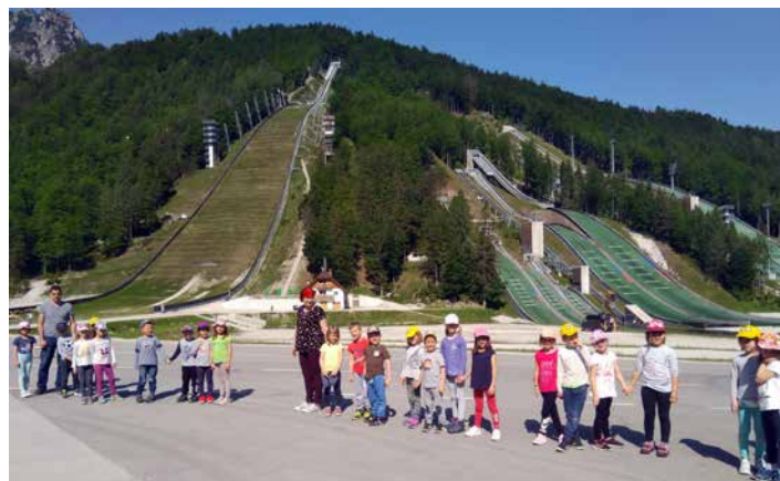
Pogled na planiške skakalnice, junij 2019.

imenovano Tamar. Bilo je kaj videti. Turisti so prihajali z vseh koncev sveta; skakalci so imeli ravno trening na mladinski skakalnici, zgrajeni iz umetne mase; iz Bloudkove velikanke so se najbolj pogumni spuščali po jeklenici; v športnem objektu smo opazovali tek na smučeh na umetnem snegu; fotografirali smo se pri ogromnem snežaku iz čisto pravega snega.