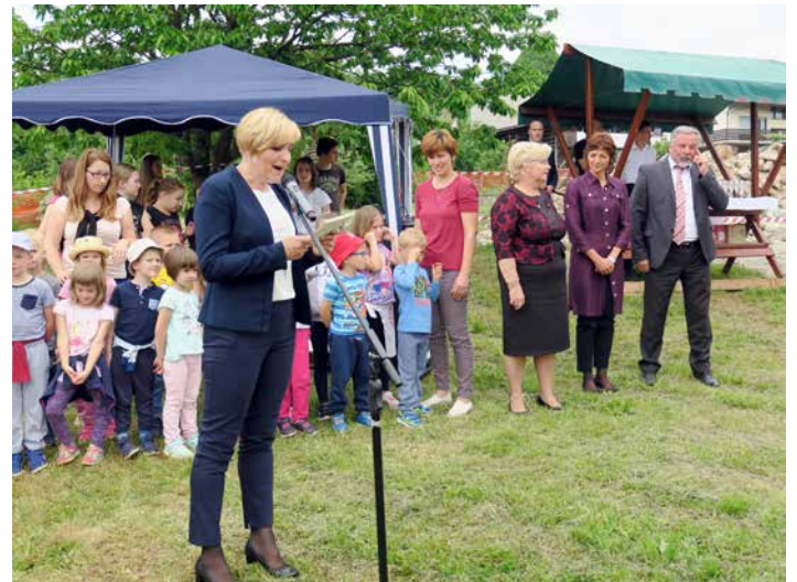
11. 5. 2018 Slovesnost ob postavitvi temeljne plošče za izgradnjo novega vrtca.