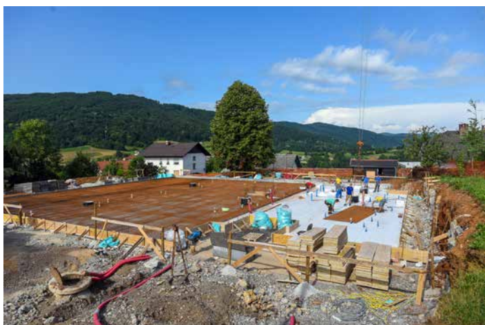
13. 6. 2018 Čez dober mesec je na istem mestu stala temeljna plošča za novo stavbo.