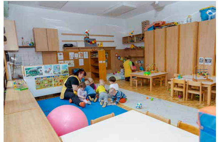
V tej igralnici so gnezdili Ptički, naši najmlajši varovanci.