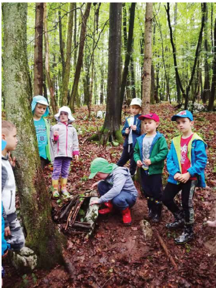
Gozdne dogodivščine; letovanje v CŠOD Čebelica, maj 2019.

Da bi otrokom olajšali izkušnjo prenočevanja izven družine, smo letos pred letovanjem izvedli noč v vrtcu. Otroci so se v vrtec vrnili pozno popoldne. V igralnici smo najprej pripravili skupna ležišča – blazine za spanje, nato smo se po medvedovih stopinjah odpravili na lov za skritim zakladom. Vzgojiteljice so za večerjo spekle slastne palačinke in po pravljici smo vsi skupaj brezskrbno zaspali. V Žužemberku so vzgojiteljice noč v vrtcu navezale na grajski teden in slastne večerje niso pripravili otroci iz oddelka Ribice, pač pa prave kraljice in kralji.