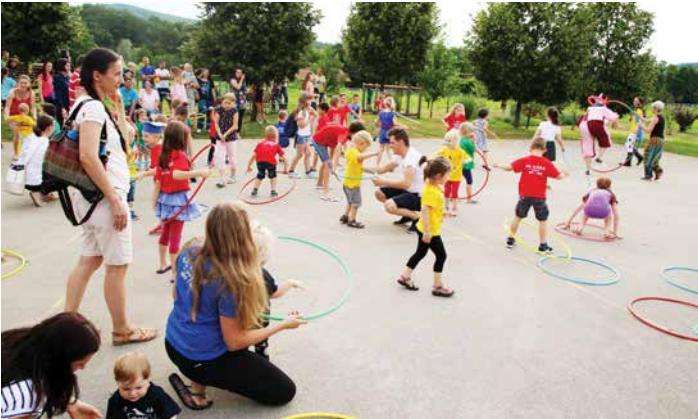
Zaključna animacija s hula hop obroči, junij 2018.

Vsa srečanja vsebujejo prav tako zanimive delavnice z izdelki, ki jih pripravimo in vodimo delavke. Otroci izdelke, ki jih izdelajo skupaj s svojimi starši, odnesejo domov.