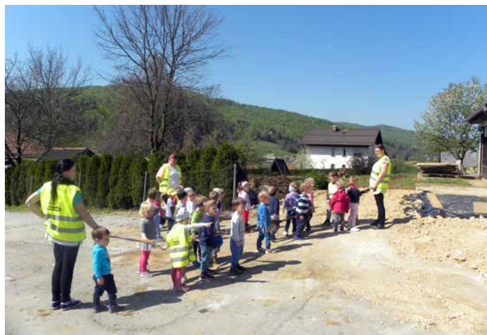
Mucki, Zajčki in Mravljice so se pogosto podali na sprehod do našega starega vrtca. »Tam smo se igrali na terasah«, so pripovedovali, april 2018.