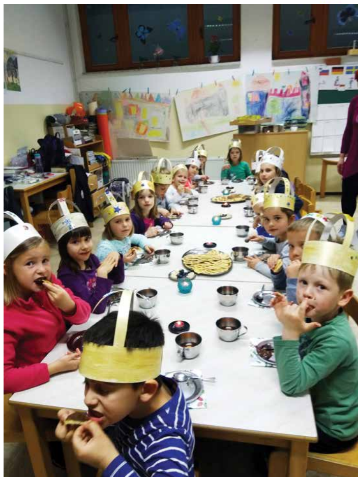
Kraljevska večerja – noč v vrtcu pri Ribicah, maj 2019.

Otroci se večkrat z veseljem spomnijo na noč v vrtcu in na letovanje, kar pomeni, da jim je bilo všeč in da je to izkušnjo vredno ponoviti.