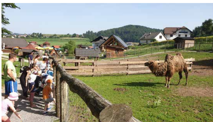
Pikapolonice pri ogledu živali, Ranč Aladin, junij 2019.

P o nekajletnem premoru je leta 2014 v našem vrtcu ponovno zaživelo cici varčevanje. Otroci ob tem, ko mesečno v vrtec prinesejo dogovorjen znesek, krepijo svojo odgovornost, spoznavajo denar ter si pridobivajo izkušnjo o pomenu varčevanja, denar pa namenimo za izvedbo zaključnih izletov. Otroci iz oddelkov od 3 do 4 leta vsako leto obiščejo Ranč Aladin, kjer spoznavajo različne domače in tuje živalske vrste in neznansko uživajo ob igri na zanimivih igralih.