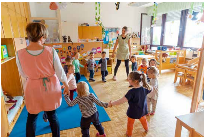
Mucki med eno od zadnjih rajalnih iger v starem vrtcu.