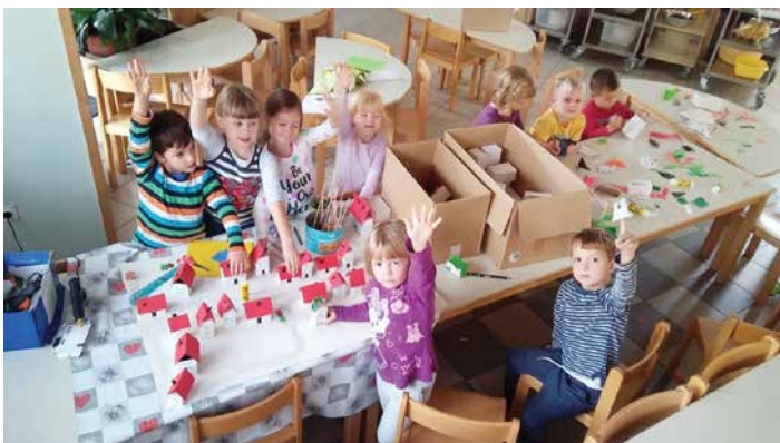
Maketa Dvora s prikazom varnih poti in nevarnih točk v prometu, ki je nastala v okviru projekta Varne v vrtec, september 2017.

Že ob začetku šolskega leta vzgojitelji namenimo veliko pozornosti seznanjanju otrok z varno udeležbo v prometu. Z aktivno udeležbo in preko raznolikih zanimivih dejavnosti otroci v vrtcu nadgrajujejo znanje o varnosti v prometu. Septembra skupine 2. starostnega obdobja obišče naš rajonski policist. Mlajše otroke spremlja na sprehodu, s starejšimi se tudi pogovarja v skupini. Otroci iz najstarejših skupin sodelujejo v projektu Društva Sobivanje Varne v vrtec, v okviru katerega raziskujejo varne in nevarne poti v domačem kraju.