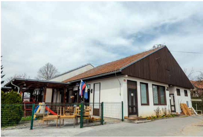
Pogled na vhod v stari vrtec na Jurčičevi, kjer je varstvo potekalo od l. 1976 do aprila 2018 – kar 42 let - že v pripravih na selitev pred rušenjem.