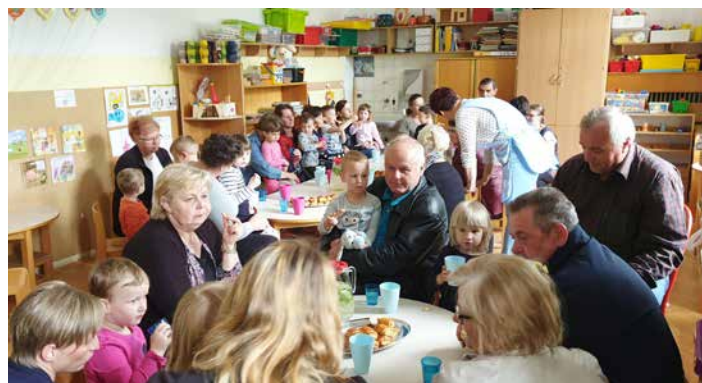
Čajanka s starimi starši v oddelku Mravljičice, maj 2019.

Zaključno srečanje , ki se odvija v juniju, je pozdrav poletju in slovo od sovrstnikov, vzgojiteljic ter malih maturantov. Starši ponosno spremljajo svoje male velike otroke, ki se poslavljajo od vrta in bodo jeseni prestopili šolski prag. Koliko ponosa in samozavesti premorejo, se ne da opisati, treba je pogledati. Svečano stojijo v maturantskih čepicah, nastopajo in na koncu dobijo prav posebno pohvalo. Drugi del srečanja je namenjen neformalnemu druženju in različnim delavnicam ter sladkanju s sladoledom.