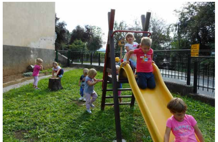
Ob selitvi na nadomestne lokacije smo ob stari šoli uredili igrišče za najmlajše.