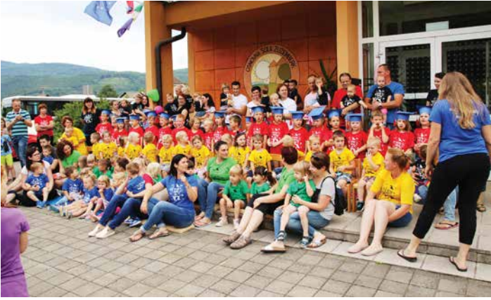
Mavrična podoba, ki so jo na zaključnem srečanju naslikali otroci enote Dvor, junij 2018.