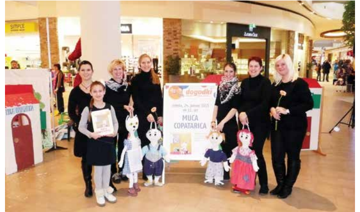
Gostovanje Muce Copatarice v izvedbi delavk enote Dvor v Nakupovalnem centru Qlandia v Novem mestu, maj 2014.

Žužemberku gostovale tudi v NC Qlandia v Novem mestu.