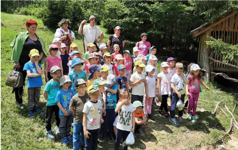
Skupinska fotografija Ribic in Metuljev, junij 2019.