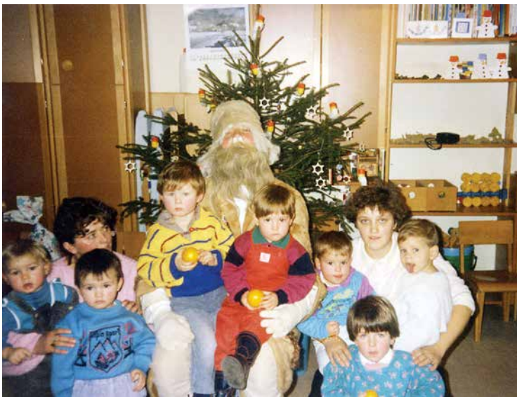
Otroci iz Družinskega varstva Škufca na obisku v prostorih starega vrtca na Dvoru.

Leto 1985 : Februarja je začel potekati program celoletne priprave otrok na šolo. Vključenih je bilo 18 otrok.