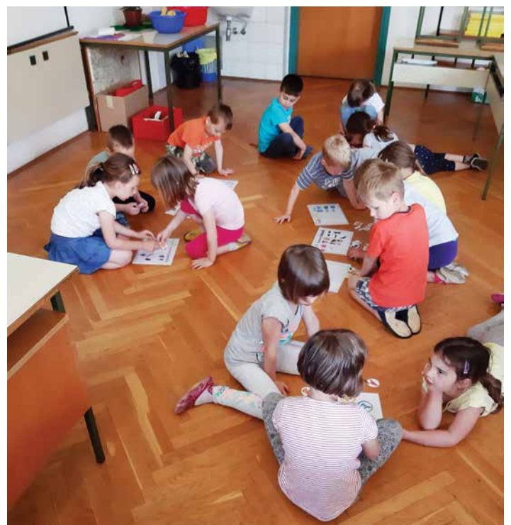
Ribice pri zabavnem učenju angleščine, maj 2019.

V mesecu aprilu sva učiteljici razrednega pouka OŠ Žužemberk enkrat tedensko začeli izvajati vesele angleške urice. V dejavnost so se vključili predšolski otroci oddelka Ribice in Metulji. Otroci so spoznavali angleški jezik preko igre, pravljič in pesmi, saj le-te v njih vzbujajo zanimanje in radovednost. Igra je njihov svet, zato se takrat počutijo sproščeno. Otroci so pri dejavnostih izkazali dojemljivost za slušno podobo jezika. Spoznali smo, kako se pozdravi in predstavi v angleškem jeziku, čustva, števila, barve in živali. Čas nam je minil zelo hitro, saj smo se med spoznavanjem angleškega jezika tudi zabavali. »Goodbye kindergarden, hello school!« ☺