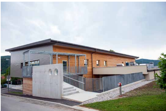
April 2019 Leto dni od naše selitve je na starem mestu na Jurčičevi ulici 41 zrasel naš nov vrtec – enota Jurček, pogled z zgornje strani.