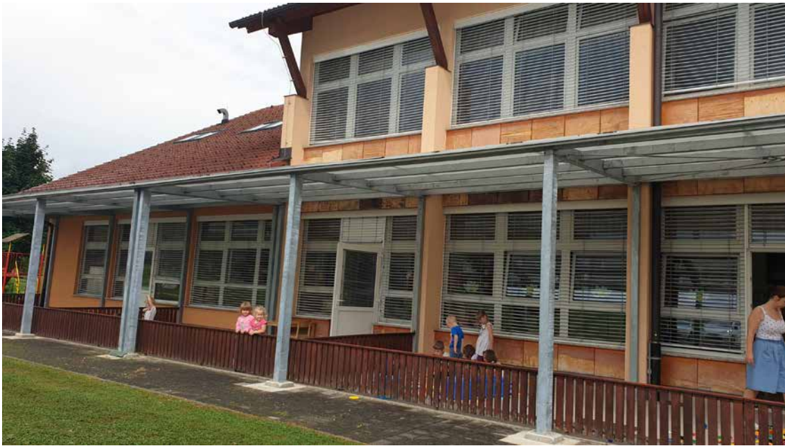
Dobrodošla in težko pričakovana pridobitev v Vrtcu Dvor - pokrite terase.

Leto 2017/18 : Jeseni so bile v enoti Dvor pri treh igralnicah pokrite terase, za kar so bila porabljeni sredstva, zbrana na dobrodelnih koncertih OŠ in Vrtca Žužemberk leta 2014, 2015 in 2016. Preostanek sredstev je zagotovila Občina Žužemberk. Po začetku delovanja 12. oddelka, februarja 2017, je število vključenih otrok ponovno naraslo na 201, na čakalnem seznamu za sprejem med letom je spet ostalo nekaj otrok. Zaradi začetka gradnje novega vrtca na obstoječi lokaciji v Žužemberku smo aprila tri oddelke iz enote na Jurčičevi ulici preselili v nadomestne prostore; oddelek Medvedki iz VVD Brulec je postal polni oddelek in se je preselil v zbornico Vrtca Dvor, Ptički z Jurčičeve ulice so našli družbo pri Polžkih v VVD Brulec, Miškolini so se naselili v dvorani prizidka telovadnice v OŠ Žužemberk, Ribice