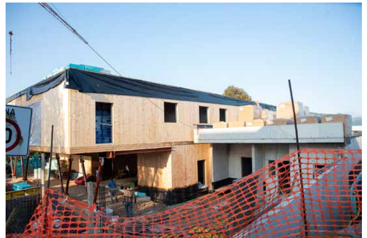
28. 8. 2018 Dograjena zgornja etaža – pripravljena na postavitve strehe.