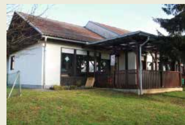
Današnji vrtec na Jurčičevi ulici je star in energetske izjemno potraten.