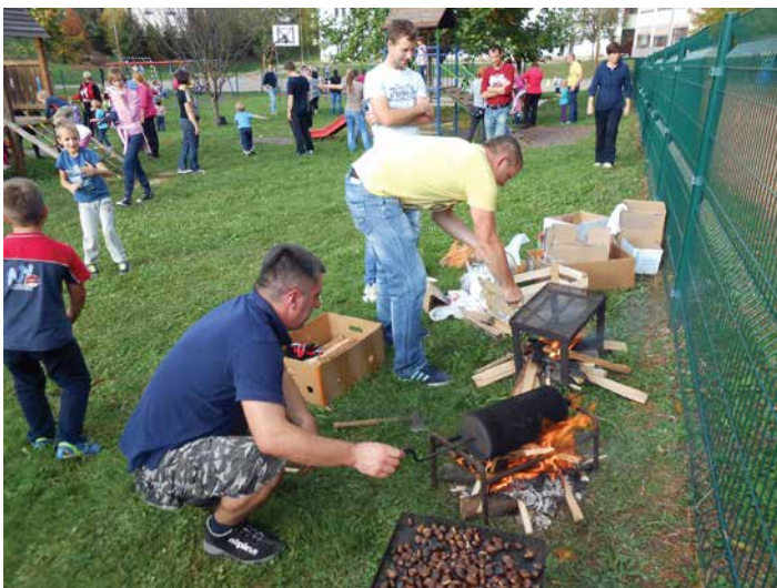
Kostanjev piknik v stari šoli, oktober 2014.

Zelo dobro obiskane so vse oblike neformalnih druženj in srečanj, ki jih pripravljamo na nivoju skupine, enote ali celega vrtca. V jeseni je to kostanjev piknik , kamor povabimo starše in stare starše. Pred leti smo kostanjeve piknike organizirali v dopoldanskem času in nanje povabili stare starše, ker pa so danes večinoma babice in dedki še zaposleni, smo se prilagodili temu dejstvu in jih organiziramo popoldne. Piknik je priložnost, da se starši in stari starši otrok iz skupine prvič neuradno srečajo. Da je na pikniku še bolj veselo in zanimivo, običajno pripravimo različne gibalne dejavnosti in igre, pri katerih sodelujejo starši in otroci. Nekateri starši se pridružijo vzgojiteljicam in jim pomagajo pri peki kostanjev, kar je vedno dobrodošlo, še posebej za njihove otroke, ki ob opazovanju svojih očetov zrastejo in pridobijo samozavest.