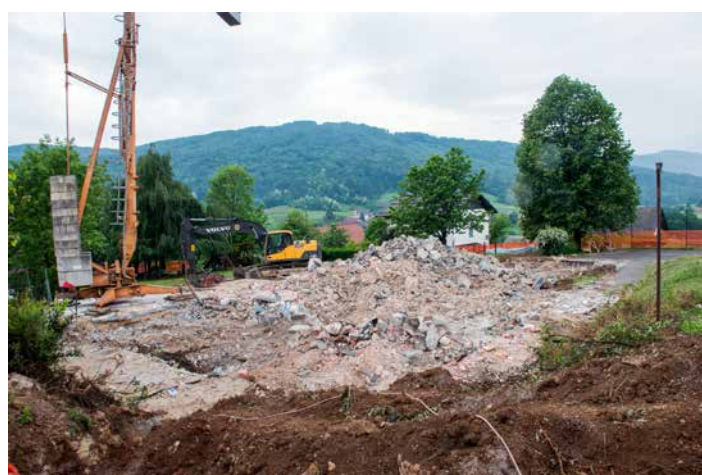
14. 5. 2018 Odstranjevanje temeljne plošče - še zadnjega dela starega vrtca.