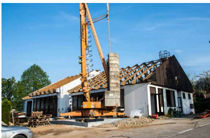
25. 4. 2018 Podoba starega vrtca po slabem tednu od začetka rušenja.