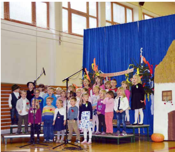
Zaključek projekta Poroke nekoč z javno prireditvijo, Žužemberk, oktober 2014.