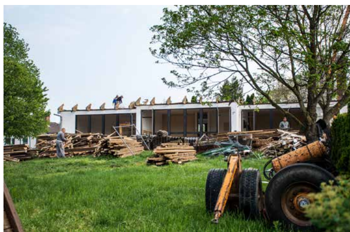
26. 4. 2018 Že naslednji dan so od vrtca ostale le še montažne stene.