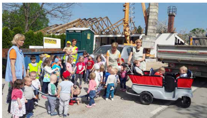
Otroci iz oddelkov Ptički in Polčki, ki so domovali čez cesto v Družinskem varstvu Brulec, so še posebej redno spremljali najprej postopek rušenja stare stavbe, potem pa gradnjo novega vrtca, april 2018.