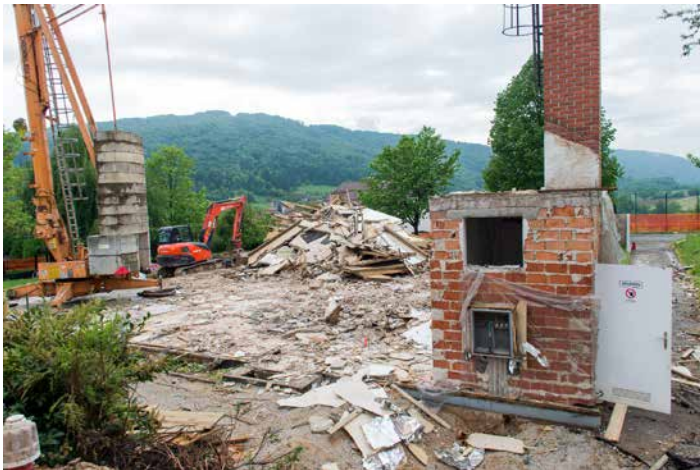
6. 5. 2018 Od starega vrtca je bilo videti le še dimnik.