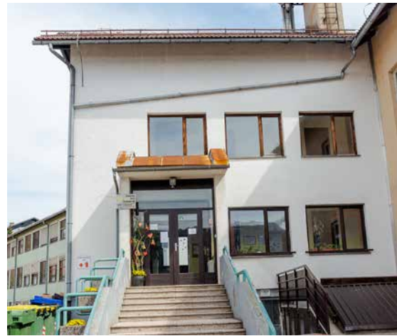
Vhod v staro šolo, kamor se je v adaptirane prostore leta 1995 preselil en oddelek vrta, kasneje sta tam dobila prostore še dva oddelka.