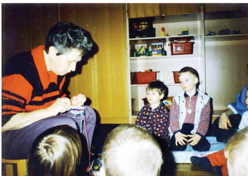
Po mnogih letih ponovno v vrtcu, tokrat kot babica.

Želim vse dobro. Vzgojiteljice, bodite do otrok tankočutne, ljubeče, tolažeče, potrpežljive, razumevajoče.