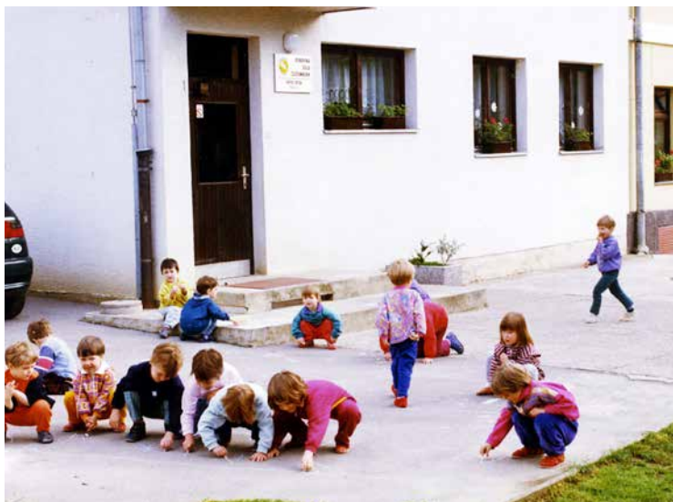
Igra otrok pred vrtcem v stari šoli na Dvoru.

Leto 1987 : Na Dvoru je bilo odprto še eno družinsko varstvo, in sicer pri sodelavki Veri Gliha. Skupaj je bilo v vzgojno varstvo vključenih 115 otrok.