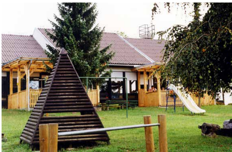
Novo terase na Jurčičevi so nudile še boljše pogoje za varstvo otrok, jesen 2000.