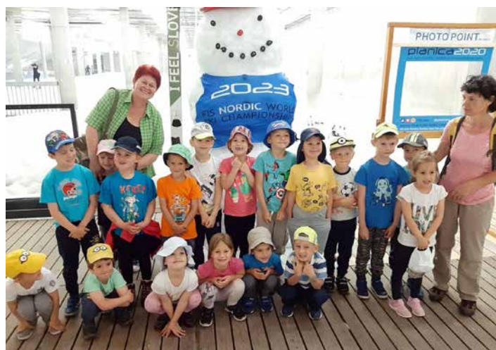
Metulji pred čisto pravim snežakom v kleti Nordijskega centra Planica, junij 2019.

Ko so bili trebuščki polni, smo se sprostili na igralih, nato nadaljevali pot do Kekčeve dežele, dežele pisatelja Josipa Vandota, kjer smo dobesedno vstopili v film. Najprej nas je pot vodila do Bedančeve kočice. Že od daleč se je valil dim in prinašal vonj po kosteh, ki jih je Bedanec kuhaval v kotlu, na ognjišču pred hišo. Iz hiše se je