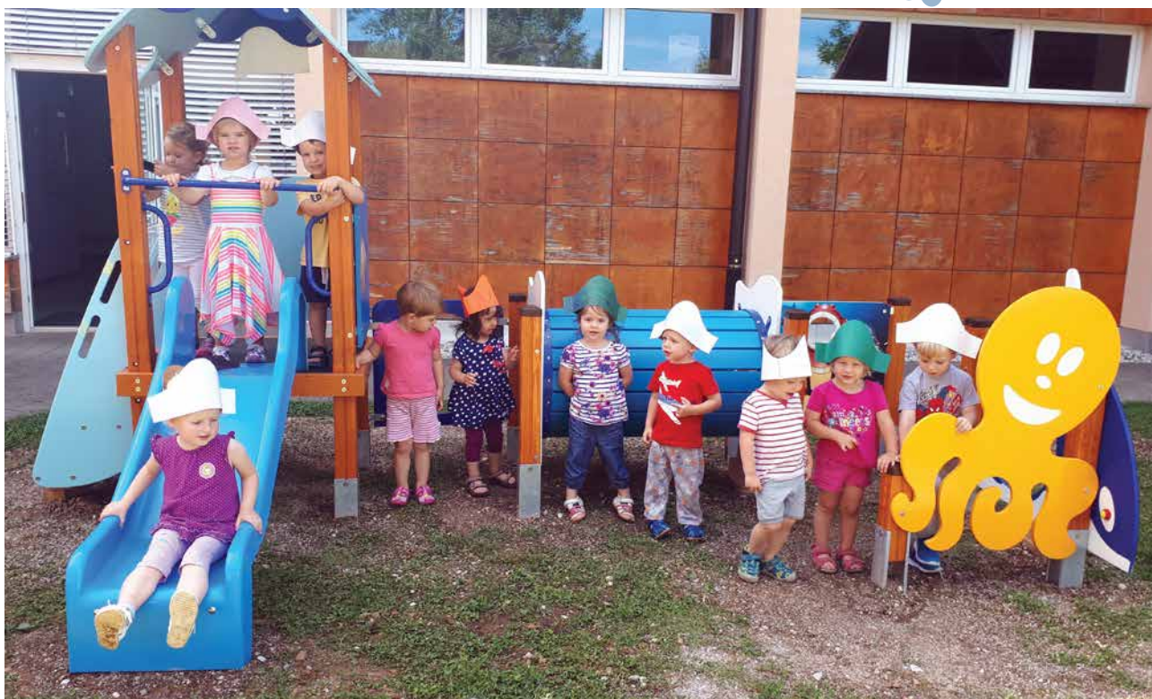
Igra na novem igralu v Vrtcu Dvor.