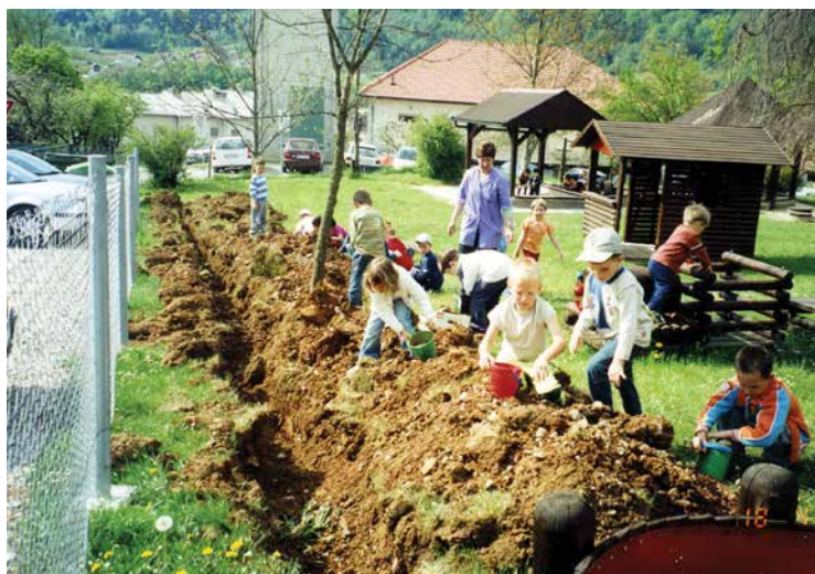
Otroci pomagajo pri pripravi terena za zasaditev cipres na igrišču v Vrtcu Žužemberk, april 2007.