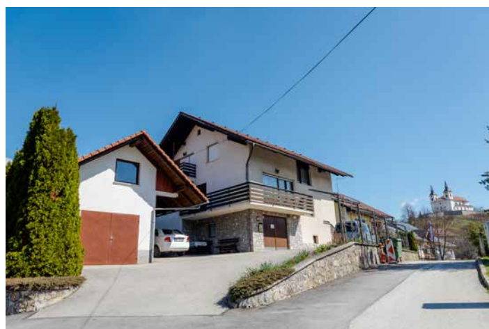
Hiša na Jurčičevi ulici 47, kjer je 25 let delovalo Družinsko varstvo Brulec.